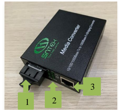
Media Converter SNTEK-Series 10/100/1000M Media Converter

* Các thông số kỹ thuật của sản phẩm có thể thay đổi mà không cần báo trước